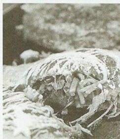
お好み、焼きそば、ねぎ焼き …旨さ以上にボリュームにも 感涙。スジねぎ焼き1,050円。